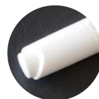
ノック式で液戻りが無く衛生的に使用できます。