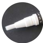
しっかり塗れる筆タイプ

プロヘアリンβ4は、毛包幹細胞の成長に大きくかわるチモシンβ4を含有するヒトオリゴペプチドを、より安全に使用できるように改良された成分です。毛包内の幹細胞の成長と分化を促し、毛根の代謝を活発にし、皮膚の状態を改善します。